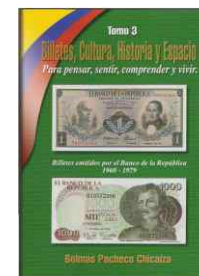
Libro: "BILLETES, CULTURA, TIEMPO Y ESPACIO" Autor Bolmas Pacheco