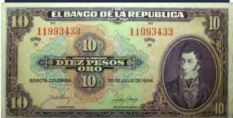
10 Pesos (1944-07-20)