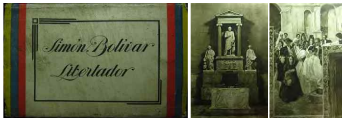
Paquete 10 fotografías Simón Bolívar Libertador