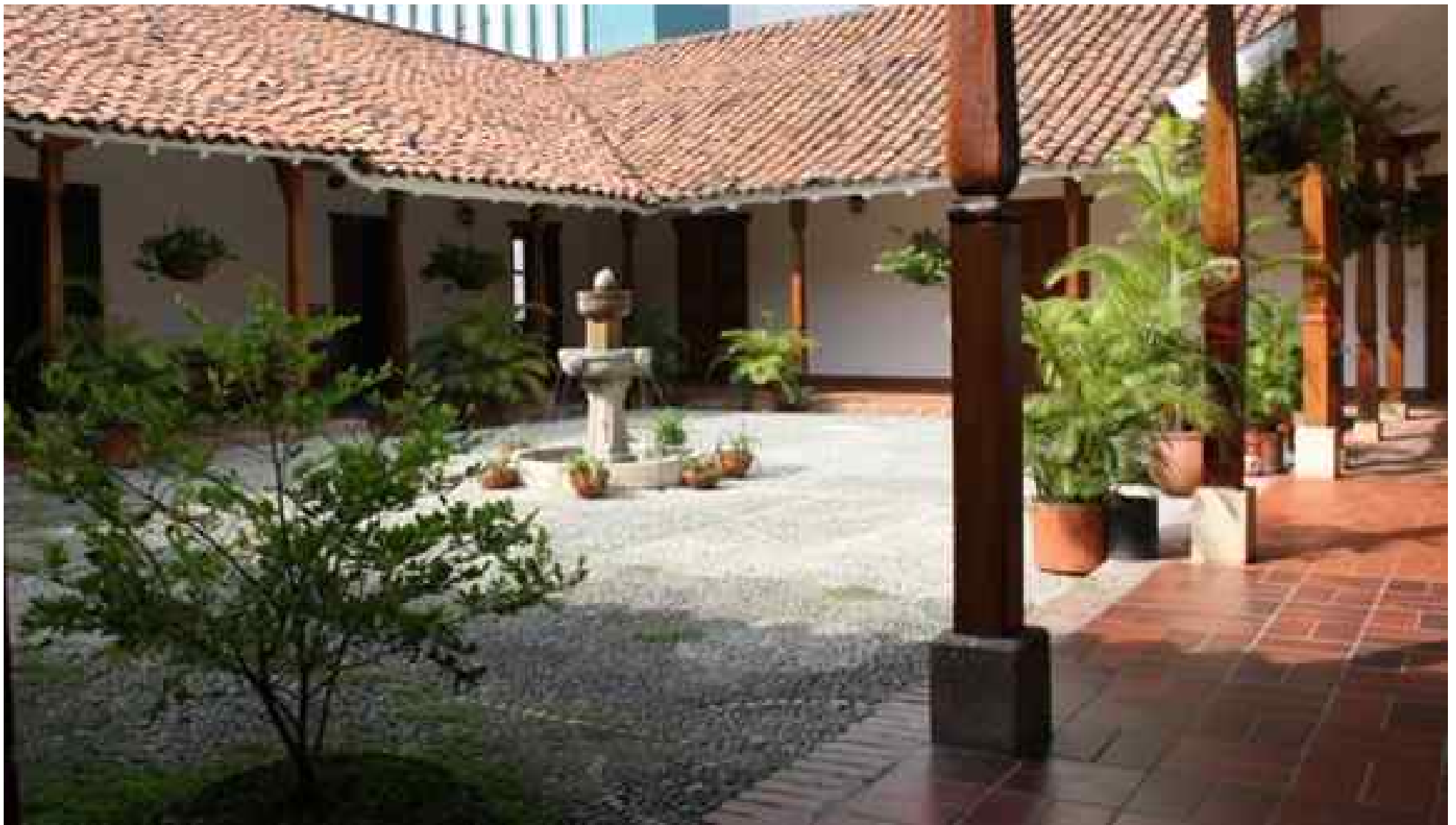
Casa de la Sociedad de Mejoras Públicas de Cali 3:00 p.m.