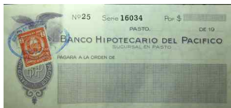
Cheque Banco Hipotecario del Pacífico (Pasto)