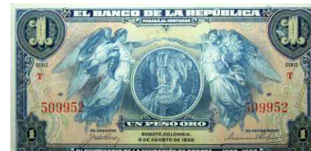
1 Peso (1938-08-06)