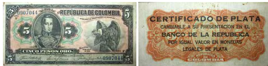
5 Pesos (1915-07-20) República de Colombia