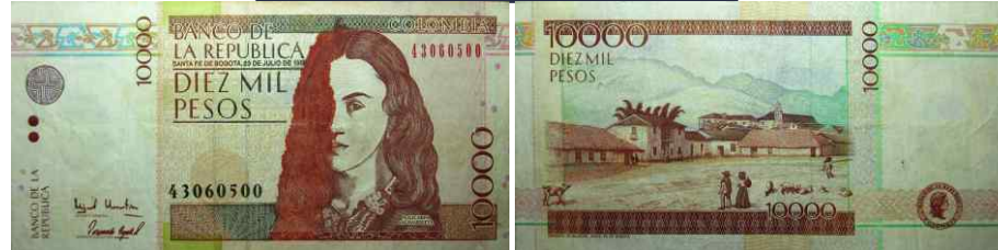
10.000 Pesos (1991-07-23) Error: Derrame de tinta