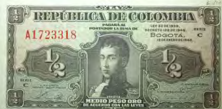
1/2 Peso (1948-01-16)