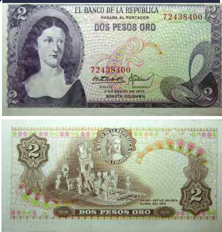
2 Pesos (1973-01-01) Error: Corte