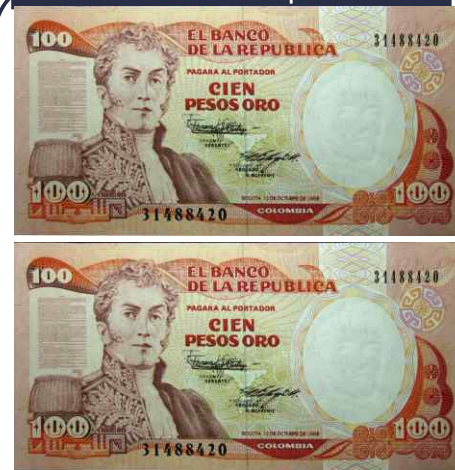
100 Pesos (1988-10-12) Error: Firmas repisadas