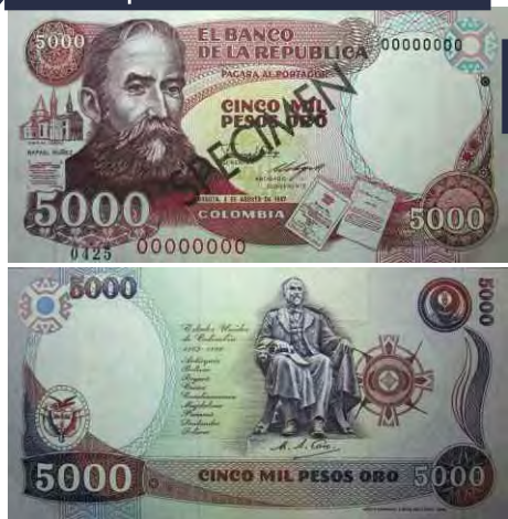
5000 Pesos (1987-08-05) Specimen No. 425