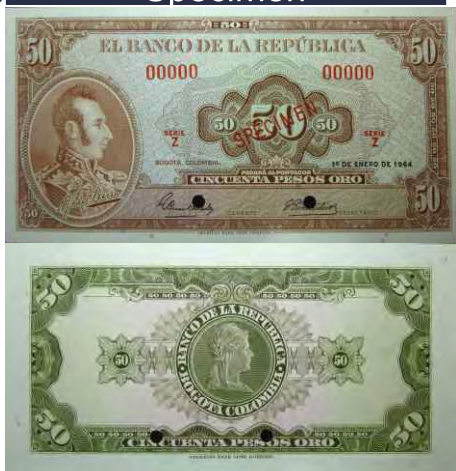
50 Pesos (1964-01-01) Specimen