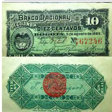
10 Centavos (1885-08-05) Banco Nacional