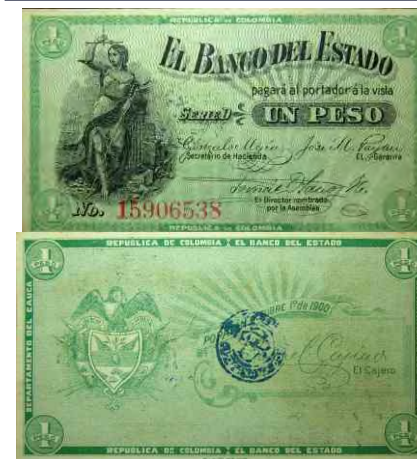
1 Peso (1900-10-01) Banco del Estado