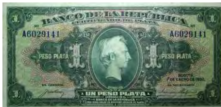
1 Peso (1932-01-01)