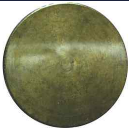
Cospel de 1.000 pesos con leyenda en el canto