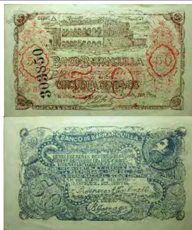
50 Centavos (1900-09-03) Banco de B/Quilla