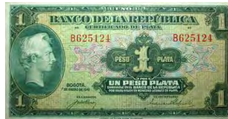
1 Peso (1941-01-01)