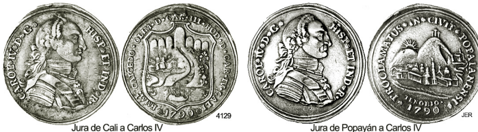
Jura de Cali a Carlos IV