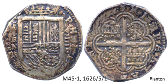
M45-1, 1626/5/1 Blanton

Tiene una H muy tenue en la parte inferior del flanco derecho del escudo