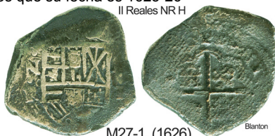
M27-1, (1626) Blanton

Una de las primeras monedas en las que llamó la atención la marca de ensayador H. Ya sabemos que su fecha es 1625-26