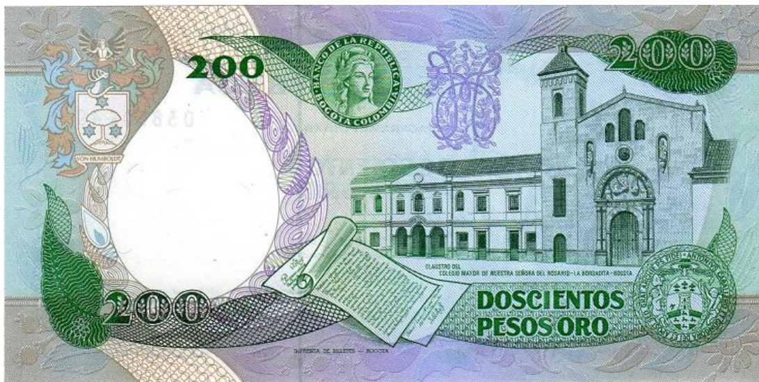
Banco de la República, 200 pesos, julio 20 de 1984 (Reverso) - Claustro de Nuestra Señora del Rosario

La preocupación por los desmanes que podrían cometer los soldados de Bolívar al ingresar a la capital se acrecentó cuando deciden tomar la Casa de la Expedición Botánica como cuartel de los triunfadores.