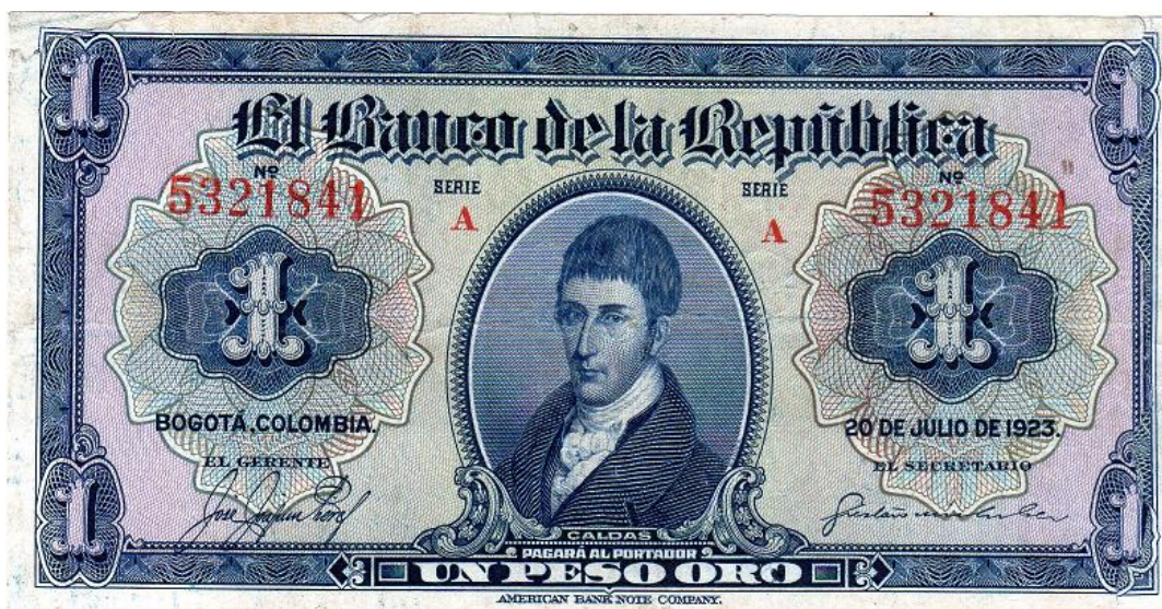
Banco de la República, un peso, 20 de julio de 1923