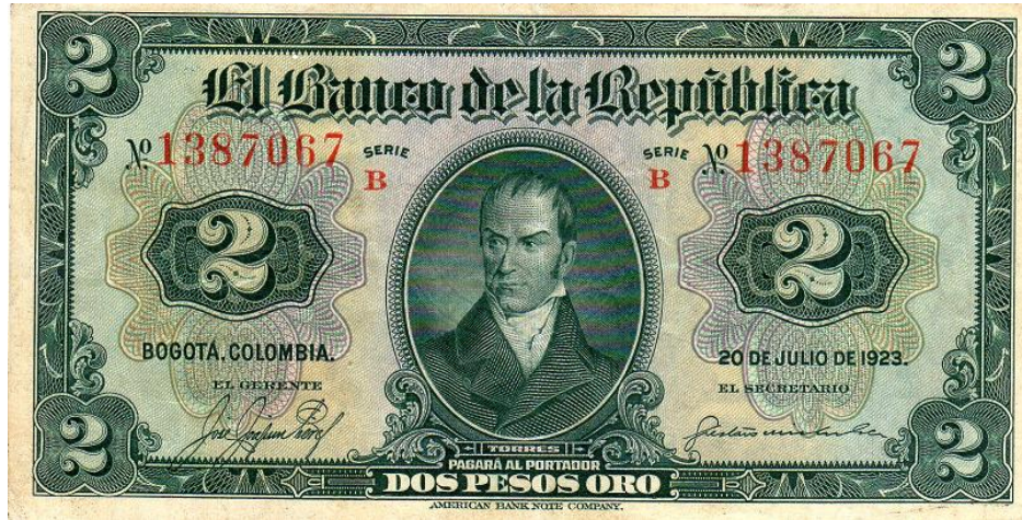
Banco de la República, 2 pesos oro, Bogotá 20 de julio de 1923

El Banco de la República también le ha rendido homenaje al prócer Camilo Torres Tenorio en tres ocasiones: