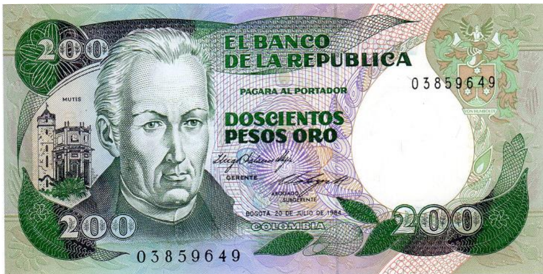
Banco de la República, 200 pesos, julio 20 de 1984 (Anverso)