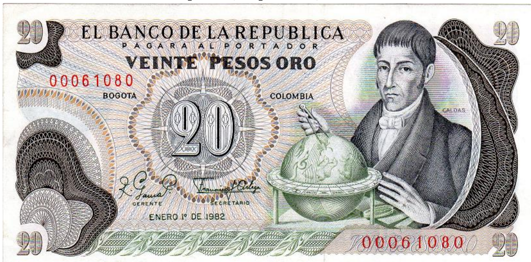
Banco de la República, 20 pesos oro, 1 de enero de 1982