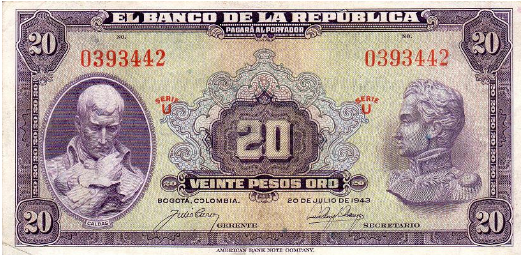
Banco de la República, 20 pesos oro, 20 de julio de 1943