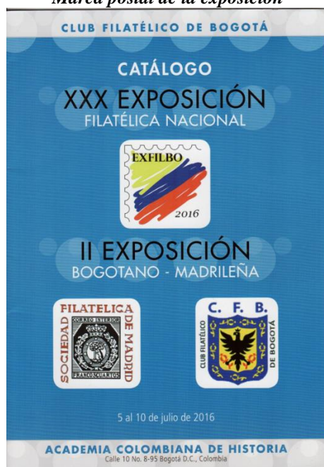
Carátula del catálogo de la exposición