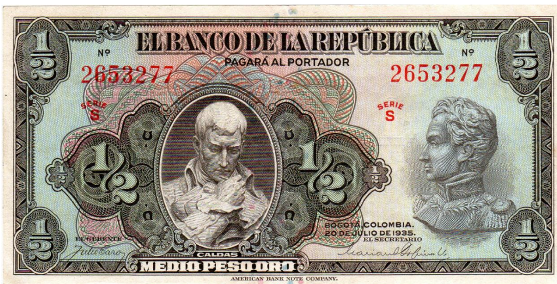
Banco de la República, ½ peso oro, 20 de julio de 1935

A quien más billetes ha dedicado el Banco de la República de Colombia es al payanés, Francisco José de Caldas. En cinco diferentes emisiones vemos la imagen de este prócer y mártir de nuestra Independencia.