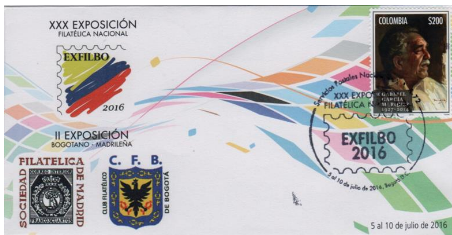
Marca postal de la exposición