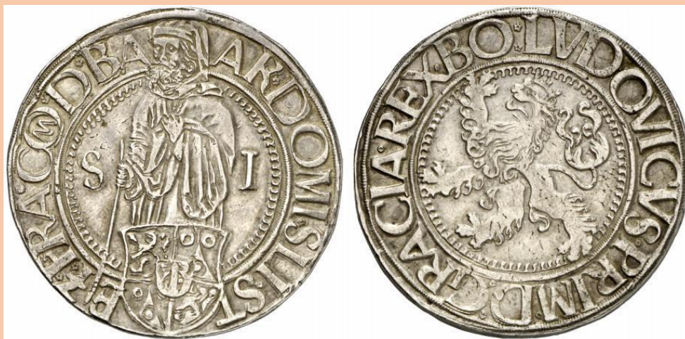
Moneda llamada “Joachimsthaler”

Desde el punto de vista lingüístico el thaler, denominado en holandés ‘rijksdaaler’, y el dólar proceden de la misma raíz.