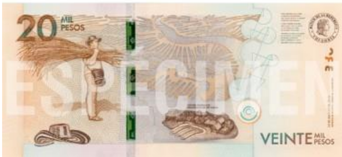
Anverso y reverso del nuevo billete colombiano de 20 Mil pesos