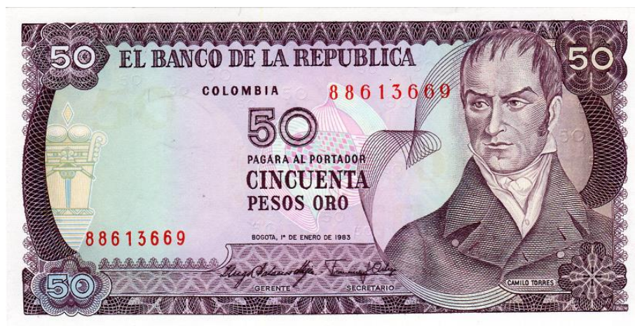
Banco de la República, 50 pesos oro, Bogotá 1 de enero de 1983