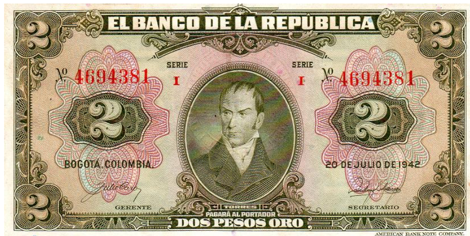
Banco de la República, 2 pesos oro, Bogotá 20 de julio de 1942