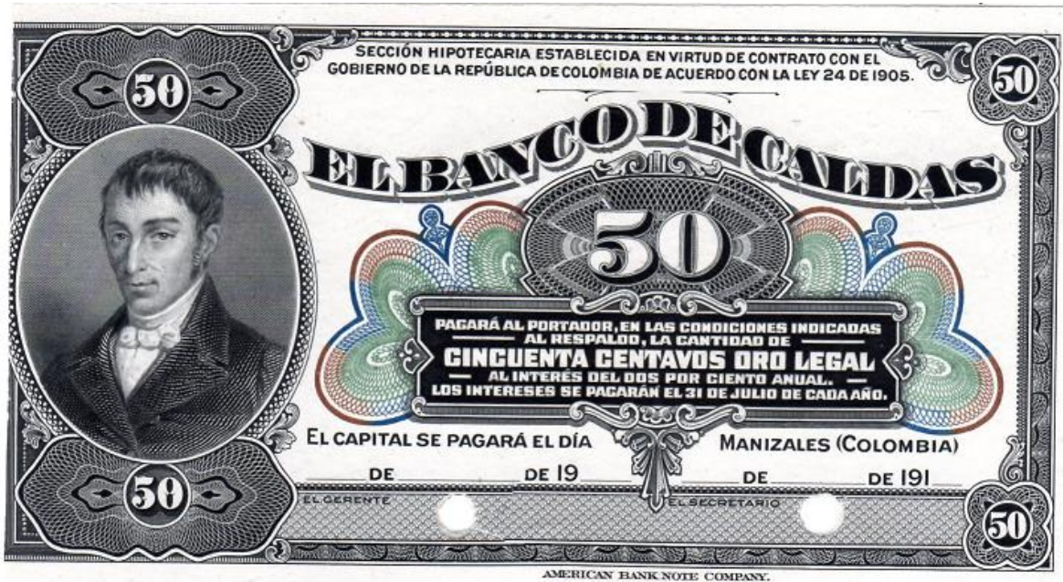
El Banco de Caldas, 50 centavos oro legal, Manizales, 1905

En bancos privados también apareció la imagen del sabio Caldas. El Banco de Caldas de Manizales, que funcionó en la misma ciudad a principios del siglo pasado, tuvo a Caldas como su imagen principal en la única emisión que realizó por valores de cincuenta centavos, uno, dos, cinco, diez y veinte pesos.