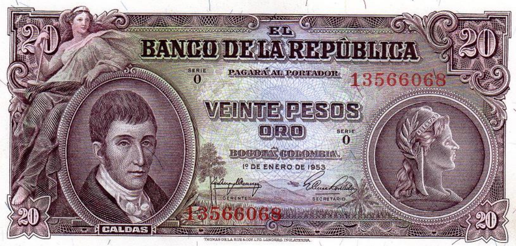
Banco de la República, 20 pesos oro, 1 de enero de 1953