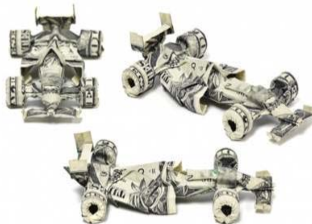
Trabajos manuales de Won Park con billetes