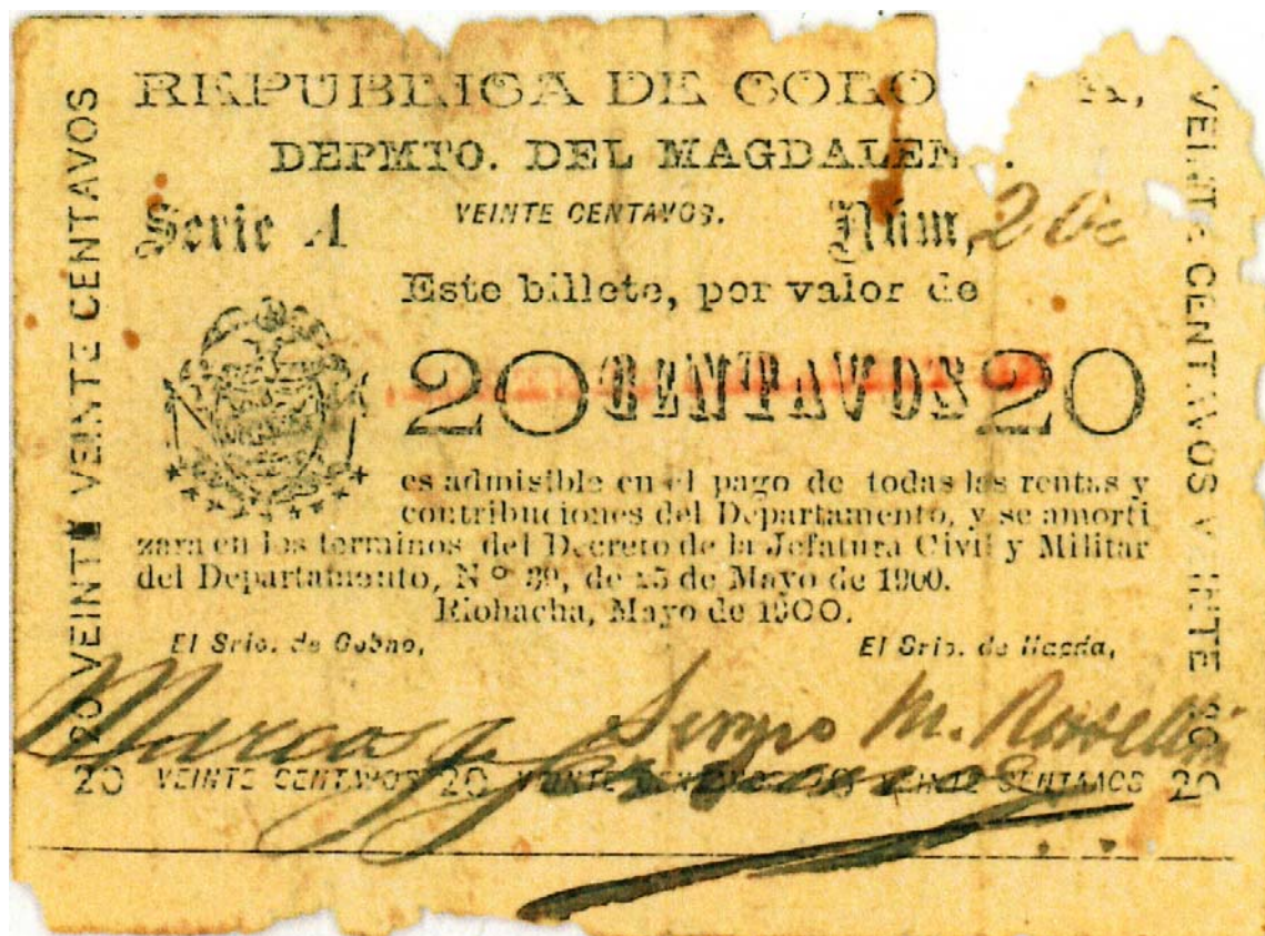
Departamento del Magdalena, Veinte centavos, Riohacha, 1900

Veinte centavos (anverso): Pick 1126. Como nota curiosa, este es el mismo billete que aparece en la imagen del Catálogo Mundial de Billetes Pick.