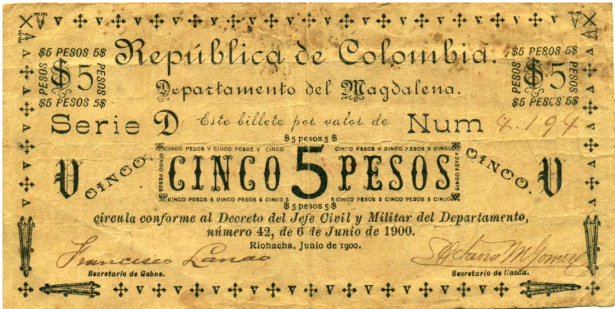
Departamento del Magdalena, cinco pesos, Riohacha, 1900