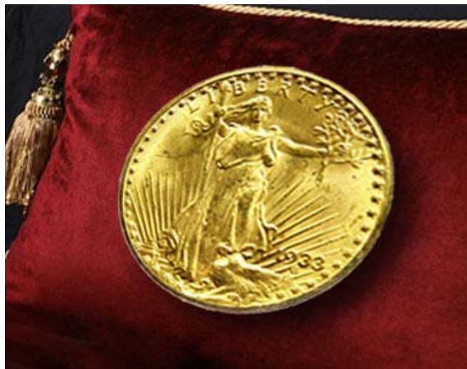
20 dólares (un águila doble) de 1933

monedas antes emitidas. Hoy solo quedan 13: en su mayoría robadas de la Casa de la Moneda. Durante décadas los cuerpos policiales cumplieron meticulosamente con la ordenanza de Roosevelt, persiguiendo a los que sacaban de sus escondites un águila doble para venderlo a algún coleccionista dentro o fuera del país y destruyendo el resto de la serie. Pese a los esfuerzos de los servicios especiales, tres monedas se revelaron sólo en julio pasado, después de que una heredera de 'bona fide' las sacara de un depósito de seguridad perteneciente a su padre, muerto recientemente. El último de los ejemplares antes conocidos, que había pertenecido durante un tiempo al rey Faruk I de Egipto, fue requisado en los años 1990. Se cree que precisamente aquel ejemplar, tras varios procesos judiciales, fue subastado a un coleccionista anónimo y ahora puede observarse en la exhibición londinense. La moneda tiene una denominación de veinte dólares. Muestra en su anverso una figura femenina de cuerpo entero que simboliza la libertad con una antorcha y una rama de olivo en sus manos, mientras que en el reverso aparece un águila en pleno vuelo sobre un sol naciente. Contiene poco más de 30 gramos de oro puro, siendo de una aleación de 21,6 quilates. Tomado de: http://actualidad.rt.com/tiempolibre/entretenimiento/issue_36045.html