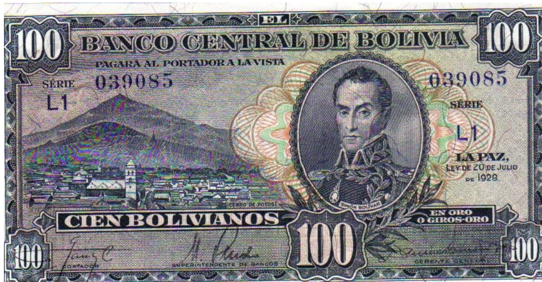
Banco Central de Bolivia, cien bolivianos