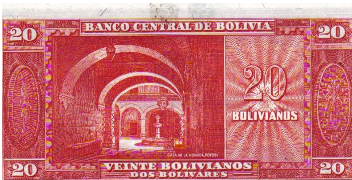
Banco Central de Bolivia, Veinte bolivianos

Precisamente, en el billete de veinte bolivianos de la Ley 20 de diciembre de 1945, aparece por el reverso, un aspecto de la Casa de Moneda de Potosí, y a los lados, ilustraciones de dos monedas acuñadas en ésta casa. Pick 140.