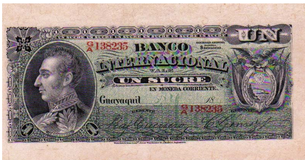
Banco Internacional de Guayaquil, un sucre 18..

El Banco Internacional de Guayaquil, en su emisión de 1882 por valor de un sucre, le rinde un homenaje al General Antonio José de Sucre. Pick 172