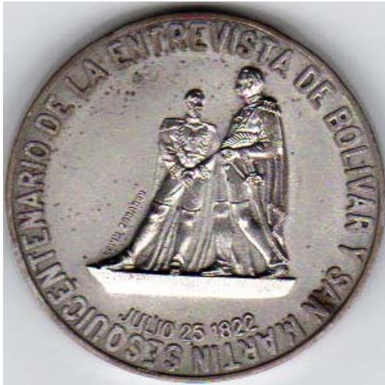
Medalla conmemorativa del sesquicentenario de la entrevista de Bolívar y San Martín

Esta medalla sirve como testimonio de la hermandad que ha existido y debe seguir existiendo entre los mandatarios de los países americanos.