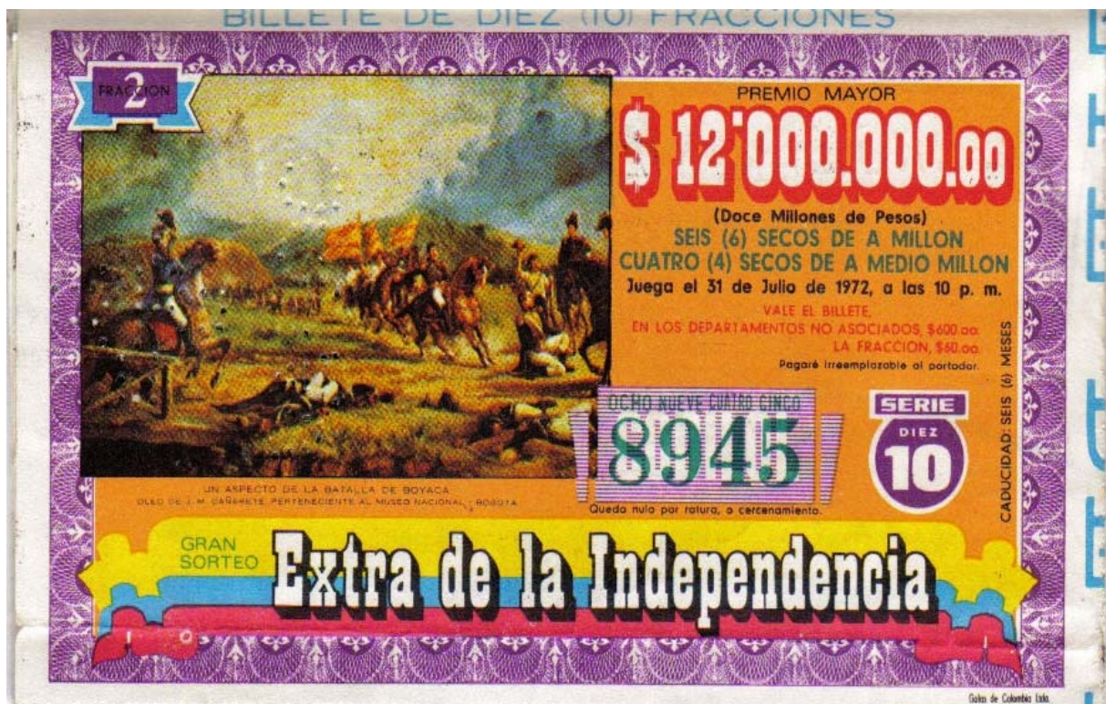
Billete de la lotería Extra de la Independencia de 1972, con detalle de la Batalla de Boyacá

Este billete completo, fue exhibido en la reciente exposición numismática que ya les hemos mencionado.