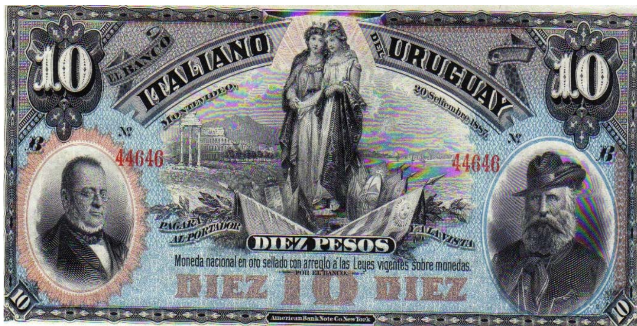
Banco Italiano del Uruguay, Diez pesos, 1887