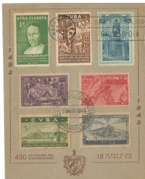
Todos los sellos correspondientes a la emisión conmemorativa por el 450 aniversario del Descubrimiento de América

Sin embargo, sí han perdurado testimonios de aquellos intentos de conmemorar el noveno cincuentenario de la llegada de Colón a nuestras costas. El 19 de mayo de 1944 el Ministerio de Comunicaciones cubano emitió una serie conmemorativa de este evento que constaba de siete valores. Se imprimieron sellos de un centavo (imagen de Colón; color verde claro), tres centavos (Padre Bartolomé de las Casas; color marrón), cinco centavos (Monumento a Colón; color azul claro), diez centavos (Descubrimiento del tabaco; color morado), trece centavos (Avistamiento de tierra americana por Colón; color rojo) y dos sellos para correo aéreo de cinco centavos (Desembarco de Colón en Silla de Gibara; color verde oscuro) y diez centavos (Faro de Colón que se iba a construir en Santo Domingo; color gris). Al igual que lo sucedido con las monedas, la emisión de estos sellos, que había sido planeada ya en 1936, tampoco pudo realizarse en el año 1942 como se pretendía.