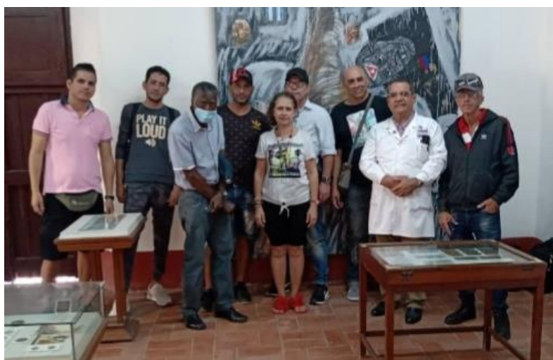
Los numismáticos camagüeyanos en Museo Casa Natal Ignacio Agramonte