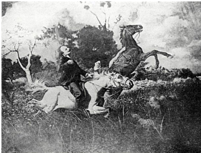
Fotografía de la pintura representando la muerte de José Martí en Dos Ríos realizada en 1917 por Esteban Valderrama

En un mensaje dirigido al Congreso el 31.07.1943 el Presidente Batista detallaba un proyecto de ley que contemplaba la acuñación de monedas de plata en una cantidad de 680,000 pesos repartidas en 400,000 monedas de cada una de las denominaciones de un peso, cuarenta, veinte y diez centavos, respectivamente. Las monedas tendrían el mismo peso, ley y tolerancia que los autorizados por la Ley de 29.10.1914.