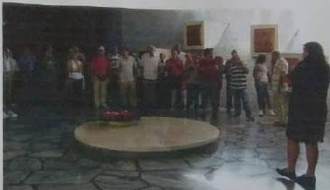
Otra imagen del recorrido de los asociados por el Museo, en el momento en que depositaron una ofrenda floral.