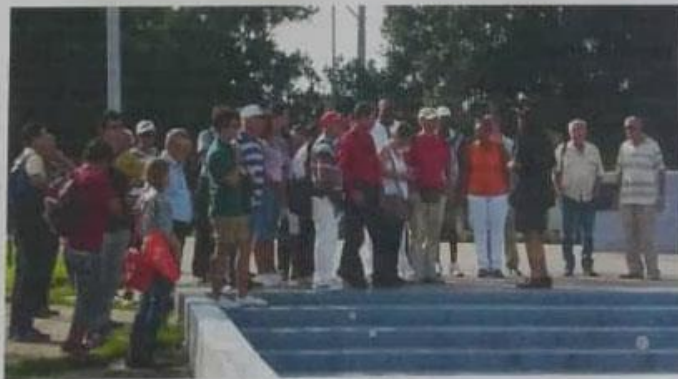
Vista de los numismáticos habaneros escuchando atentamente las palabras de la Directora del Museo, durante el recorrido.