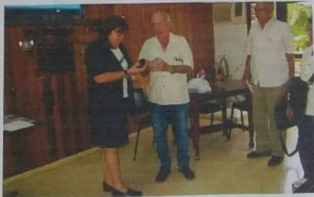
A nombre de la Asociación Numismática, su presidente le obsequia a la Directora del Museo, la moneda por el 40 Aniversario del Moncada, con la imagen de Fidel.