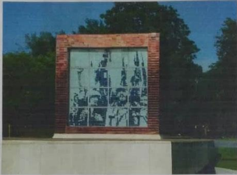
Mausoleo de los Mártires del Moncada de Artemisa, con la imagen de la foto histórica de Fidel y Raúl en el Pico Turquino de la Sierra Maestra.