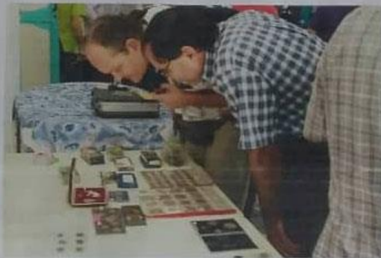
El acto de Premiación finalizó con una curiosa subasta denominada "40 por 40" (40 lotes por 40 pesos MN cada uno).