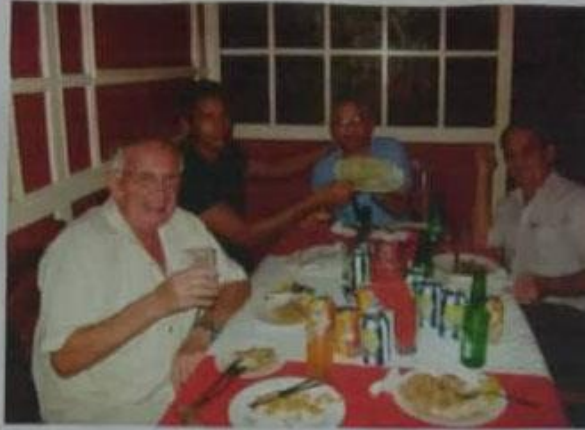
Instantánea fotográfica que muestra varios asociados durante el almuerzo en un restaurante típico de Artemisa.