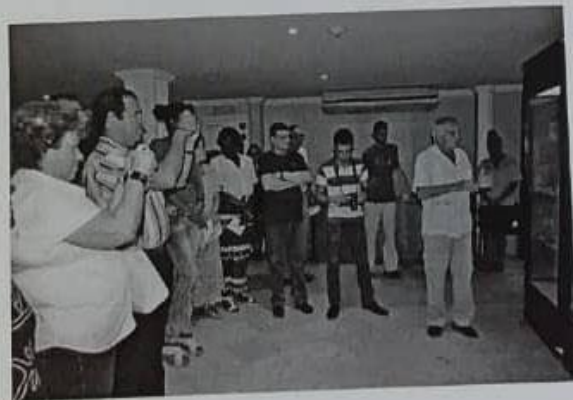
La imagen muestra el momento en que el autor de la exposición ofrece detalles de la misma.