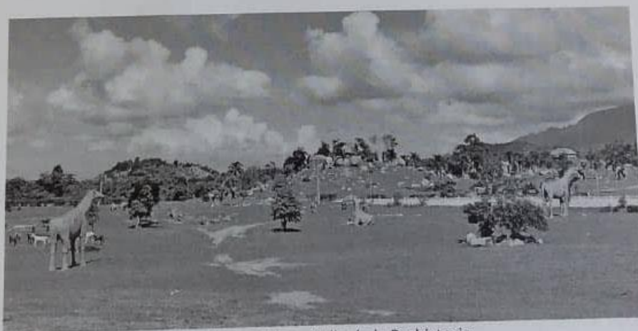
Imagen del maravilloso Valle de la Prehistoria.