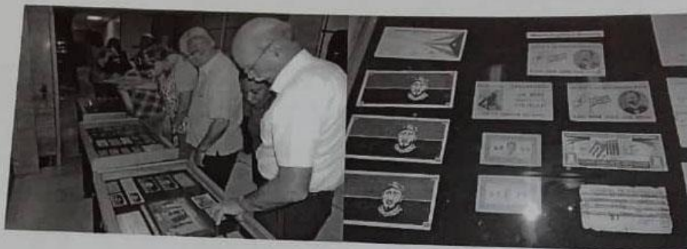
Muestra fotográfica de la exposición de los "Bonos del 26 de Julio" en el lobby del Banco Central de Cuba el 24 de julio de 2015.