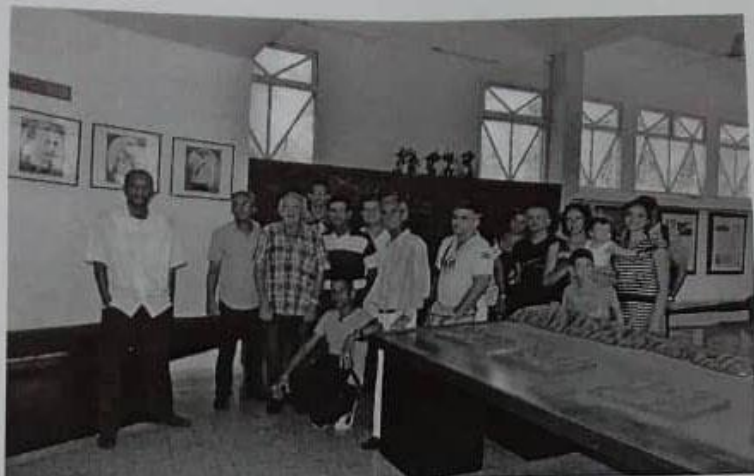
Visita al Museo de la Guerra Hispano-Cubano-Norteamericana.