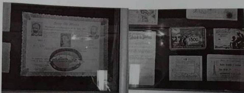
¡SANTIAGO ES SANTIAGO!