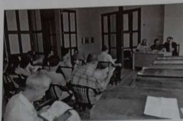
Reunión-Subasta celebrada el 26 de septiembre en Santiago de Cuba.

Miembros de la Directiva Nacional que dirigieron la discusión de los Estatutos y la Subasta.