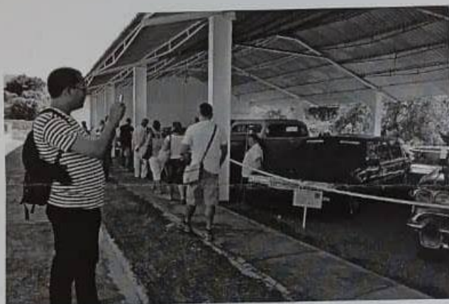
La foto muestra la visita al Museo de Autos Antiguos.