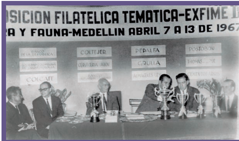
Junta Directiva Exposición Filatélica Temática EXFIME 1967