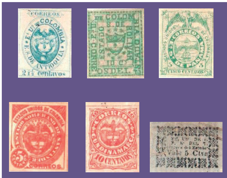
Estampillas de Estados Unidos de Colombia, colección Walter Weber

Con base en las normas legales ya señaladas y sus propios estatutos legales, la mayoría de los estados que conformaron los Estados Unidos de Colombia procedieron a reglamentar y organizar sus emisiones de estampillas, sin embargo no todos tuvieron una buena organización ni correos permanentes y algunos desistieron de ese empeño por las dificultades del transporte y la poca correspondencia entre poblados pequeños. De los nueve estados siete emitirían sus propias estampillas adhesivas para el porte de los correos.