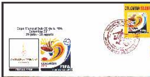
Copa Mundial Sub-20 de la FIFA Colombia 2011 Cartagena Ciudad Sede Julio 21 de 2011 Sobres 150