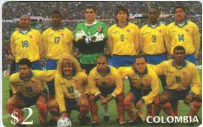
Selección Colombia, Francia 98

Junto al Fútbol, merece destacarse las emisiones de Somalia de 2002, donde entre los grandes iconos del Siglo XX, se resalta a nuestro Nobel de Literatura, Gabriel García Márquez.