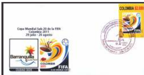
Copa Mundial Sub-20 de la FIFA Colombia 2011 Barranquilla Ciudad Sede Julio 21 de 2011 Sobres 150