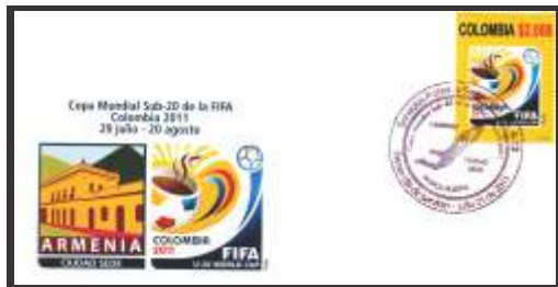
Copa Mundial Sub-20 de la FIFA Colombia 2011 Armenia Ciudad Sede Julio 21 de 2011 Sobres 150