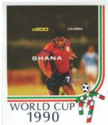
Bendito Fajardo, Ghana

De una análisis de la tabla anterior, es de destacar, que no es el café, como se podría pensar, el tema con el cual más se relaciona a Colombia en el exterior, sino que es el Fútbol, a partir del Mundial de Italia 1990, seguido de los Mundiales de USA 94 y Francia 98, donde se resaltan las grandes figuras colombianas del balón pie como Higuaita, el "bendito" Fajardo, el tino Asprilla y en especial del Pibe Valderrama.