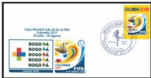
Copa Mundial Sub-20 de la FIFA Colombia 2011 Bogotá Ciudad Sede Julio 21 de 2011 Sobres 150