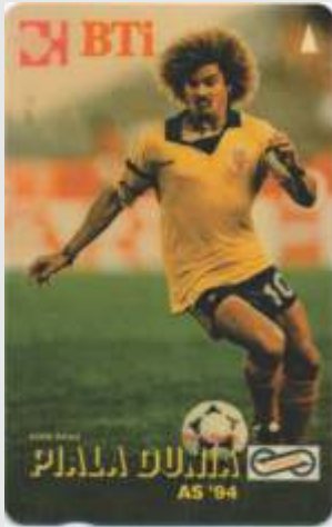
Tailandia, Pibe, 1994

Además de las estampillas, en una época, en que se usaban masivamente las tarjetas telefónicas, se pudo ver a nuestros jugadores, representadas en ellas.