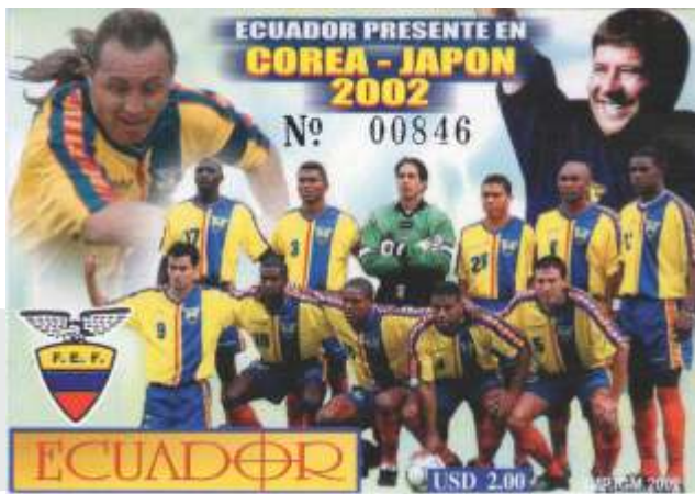
Bolillo Gómez, Ecuador

Además de los jugadores, los técnicos, como el Bolillo Gómez, es destacado por haber clasificado a Ecuador al Mundial de Corea - Japón, en 2002