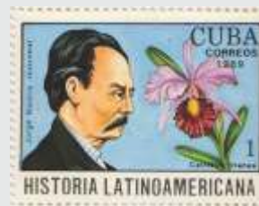
Jorge Isaacs, Cuba