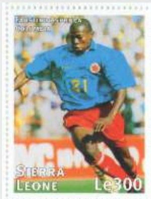
Tino Asprilla; Sierra Leona