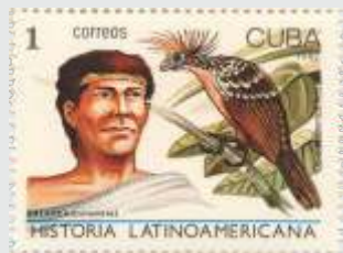
Cacique Calarcá, Cuba

Y las emisiones cubanas, con Calarcá, Antonio Nariño, Jorge Isaacs y Guillermo Uribe-Holguín, tan entrañables para nosotros y tan importantes en nuestra historia, literatura y música.