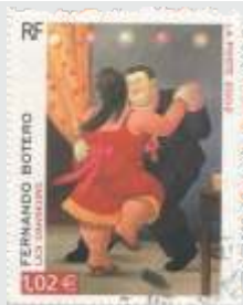
Fernando Botero, Francia

La emisión de Francia de 2002, con la reproducción de la obra Bailarines del maestro Fernando Botero.