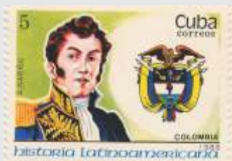
Antonio Nariño, Cuba