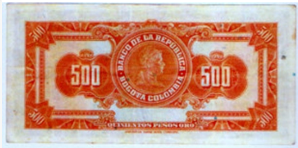
Reverso original de 1944 – Serie G