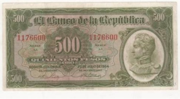
Billete original de 1964 con 7 dígitos – Serie AA

En 1964 el Gerente: E. Arias Robledo (1961 a 1970), cambió el número 6 de 1964 por un número 4.