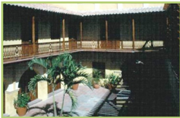
Casa de la Moneda de Cartagena de Indias, propiamente dicha, en el barrio San Diego. Originalmente esta casa estaba localizada en la calle de Nuestra Señora de la Oliva.

Los motivos alegados en esta Real Cédula para acuñar esta moneda de vellón eran el consumo de la plata corriente de esta provincia y la provisión de numerario a las islas de Barlovento y a otras vecinas. Se afirmaba en la misma que además del beneficio general que suponía recoger la plata corriente en circulación, se exoneraría de los gastos y costas que conllevara el llevarla a labrar a esta Casa de Moneda.