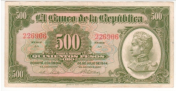
Billete de $500 de 1964, adulterado.