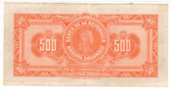
Reverso original de 1964

Borrado el primer dígito de la numeración. Era de 7, cuya numeración está entre 1.000.001 y 4.150.000