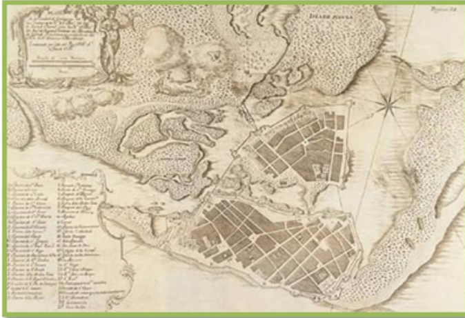
Mapa de Cartagena de Indias del siglo XVII.

encontramos numerosos documentos, informes y comunicaciones realizadas por varias autoridades referidas a su labra, a la falta de aceptación de este circulante y a las peticiones para que no se batiese moneda de vellón.