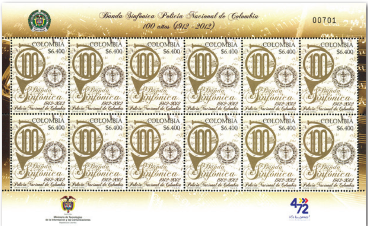
Emisión "Banda Sinfónica Policía Nacional de Colombia 100 años (1912- 2012)" Bogotá, D.C., Colombia